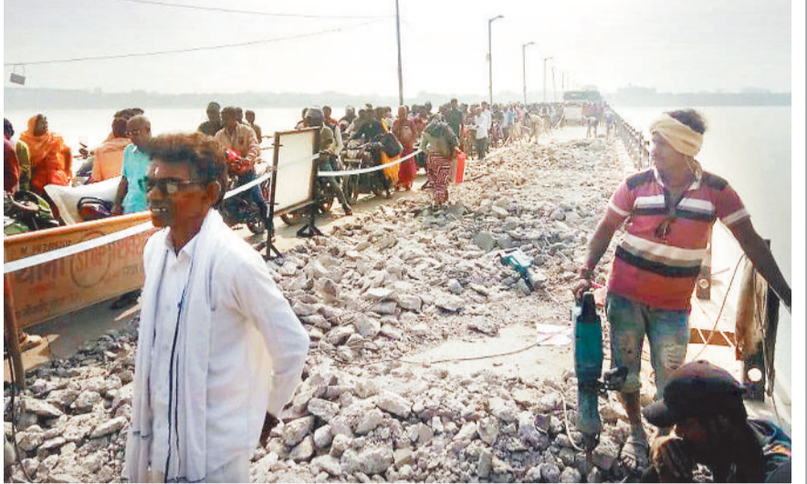
शिवरीनासरायण। शबरी सेतु के मरम्मत का काम शुरू हुआ है। करीब 25 साल पुराने पुल की हालत जर्जर हो गई थी। अब पुल की मरम्मत की जा रही है। मरम्मत कार्य पूर्ण होने के बाद आवागमन में सुविधा मिलेगी, लेकिन इसके पहले अभी राहगीरों को परेशानी झेलनी पड़ रही है। जांजगीर-चांपा जिले को बलौदा बाजार से जोड़ने वाले इस पुल पर भारी वाहन भी गुजर रहे हैं। पुल के एक हिस्से में मरम्मत का काम चल रहा है। ऐसे में संकरे पुल पर लगातार जाम की स्थिति निर्मित हो रही है।