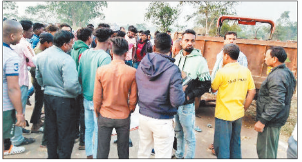
सरहर में घटना स्थल पर लगी लोगों की भीड़।