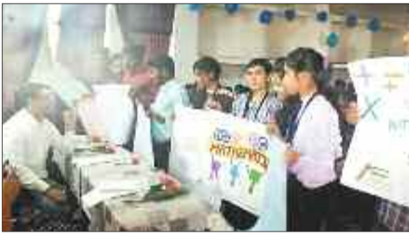
पोस्टर प्रदर्शनी में शामिल छात्र-छात्राएं।