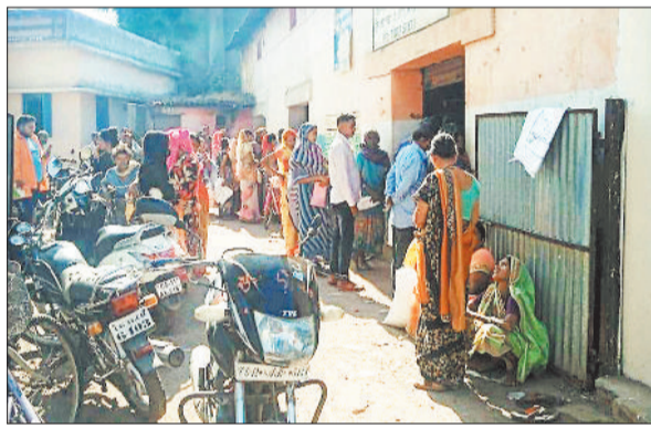
शासकीय उचित मूल्य की दुकान में राशन लेने पहुंचे हितग्राही।

अभिवाजित जिले में सस्ते दाम पर चावल पाने 5 साल के भीतर ही 1 लाख 35 हजार से भी अधिक राशन कार्ड धारी बढ़ गए हैं। पहले जहां यह आंकड़ा 4 लाख 25 हजार पर था वह अब बढ़कर 5 लाख 60 हजार पर जा पहुंचा है। गौरतलब है कि खाद्य सुरक्षा अधिनियम के तहत ग्रामीण एवं शहरी क्षेत्रों में रहने वाले पात्र लोगों को शासन की योजना के तहत सस्ते दामों पर चावल, शक्कर एवं नमक का वितरण किया जाता है, ताकि शहरी एवं ग्रामीण क्षेत्र में रहने वाले लोग भूखे ना रहें। इसी उद्देश्य को ध्यान में रखकर हितग्राहियों को सस्ते दाम पर चावल उपलब्ध भी कराया जा रहा है। कई जगहों पर नियम को ताक में रखकर मृत लोगों के नाम पर भी राशन का उठाव करने की शिकायत सामने आती रहती है। विभागीय जानकारी के अनुसार अभिवाजित जिले में जहां 5 साल पहले 4 लाख 25 हजार राशन कार्ड धारी हितग्राही थे। वहीं यह आंकड़ा अब बढ़कर 5 लाख 60 हजार 215 तक पहुंच गया है।