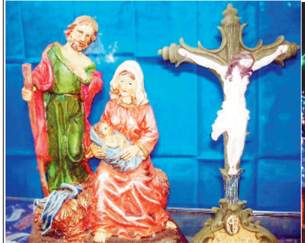
क्रिसमस पर सजा चर्च और प्रभु यीशु के जन्मोत्सव की झांकी।

सोमवार 25 दिसंबर को खीट जयंती बड़े दिन के अवसर पर नगर के मेनोनाइट तथा रोमन कैथोलिक चर्च में अनेक कार्यक्रम आयोजित