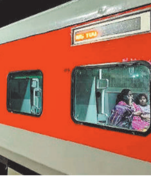
हावाला दिया है। काजीपेट-बल्लारशाह सेक्शन के हसनपार्थी पार्टी रोड स्टेशन और उपयल स्टेशन के मध्य तीसरी रेल

रेलवे ने नए साल में कोरबा से अप-डाउन की ओर चलने वाली कोचुवेली 2 दिन और यशवंतपुर सुपरफास्ट साप्ताहिक एक्सप्रेस को 4 दिन के लिए रद्द कर दिया है। इससे यात्रियों की परेशानी बढ़ गई है। यात्रियों ने पहले से ही टिकट आरक्षित कर लिया था। अब उन्हें सफर के लिए परेशान होना पड़ रहा है। दक्षिण पूर्व मध्य रेलवे बिलासपुर ने सूचना किया। ट्रेन के रद्द होने की वजह दक्षिण मध्य रेलवे में तीसरी रेल लाइन के कमीशनिंग के लिए नॉन इंटरलॉकिंग के काम का