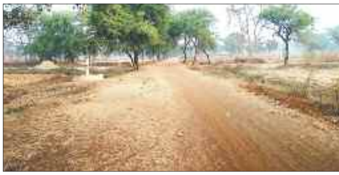
गोधना और कांसा के बीच की कच्ची सड़क।