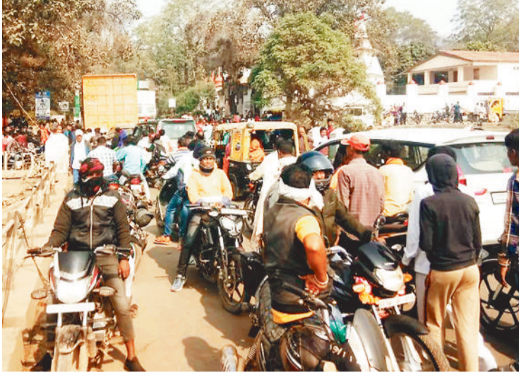
शिवरीनासरायण। शबरी सेतु के मरम्मत का काम शुरू हुआ है। करीब 25 साल पुराने पुल की हालत जर्जर हो गई थी। अब पुल की मरम्मत की जा रही है। मरम्मत कार्य पूर्ण होने के बाद आवागमन में सुविधा मिलेगी, लेकिन इसके पहले अभी राहगीरों को परेशानी झेलनी पड़ रही है। जांजगीर-चांपा जिले को बलौदा बाजार से जोड़ने वाले इस पुल पर भारी वाहन भी गुजर रहे हैं। पुल के एक हिस्से में मरम्मत का काम चल रहा है। ऐसे में संकरे पुल पर लगातार जाम की स्थिति निर्मित हो रही है।